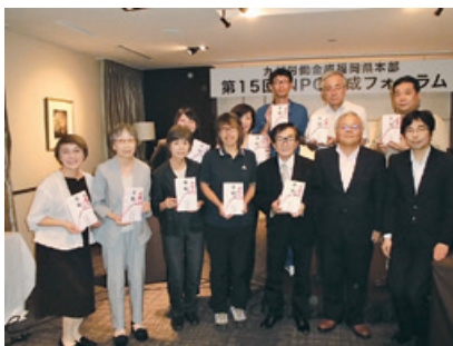
(これまでの助成団体数)

助成金は、お客さまからのボランティア預金「NPOパートナーズ」による寄付金と九州ろうきんの拠出金を財源としており、2019年3月末までに累計1,078団体へ2億34百万円を助成しました。