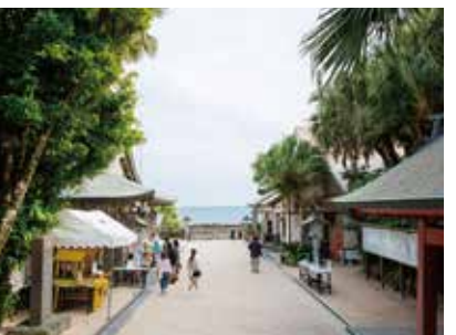
青島は周囲約1.5kmの小さな島。島を囲む「鬼の洗濯板」は国の天然記念物に指定されており、干潮時には奇岩が整列する摩訶不思議な光景が見られます。小さなカニやきれいな貝を探して磯遊びも楽しい。