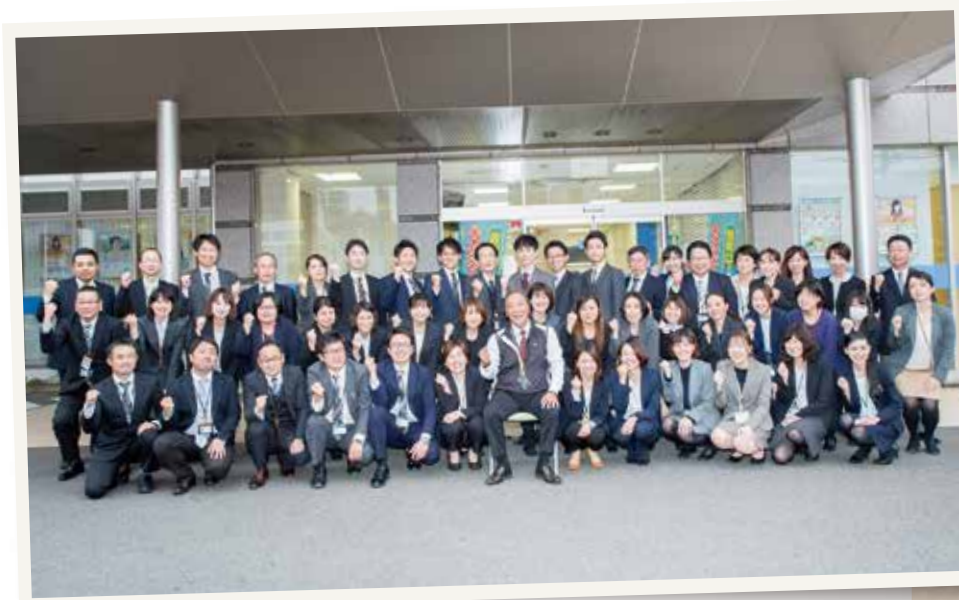
※写真は3月31日現在の職員です。