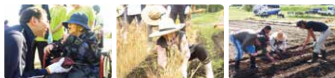
農作業には筋力の向上、仲間との交流、精神の安定などさまざまなメリットがあり、認知症改善が期待できるそうです。