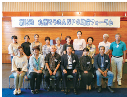
(これまでの助成団体数)